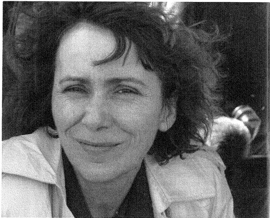
Une conscience aux aguets qui façonne à la fois sa manière d'être et de travailler : exigence absolue, méfiance radicale à l'égard des pouvoirs établis, zéro autocensure.

Dans le petit milieu du documentaire, la réputation de cette battante est assez éloignée de son aura publique. On l'y décrit comme une femme « solo », « marche ou crève », « acharnée », « ingérable ». Rétive à tout compromis qui serait dicté par des contraintes extérieures (durée du film, budget...), elle a le chic pour se brouiller avec les producteurs. Rares sont ceux qui ont passé le cap des trois films ! « Elle va très vite, directement au but,