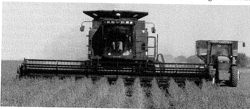
« Le Monde selon Monsanto » (diffusé dans 22 pays depuis mars 2008) : une démonstration implacable sur les effets désastreux des OGM en matière de développement agricole.