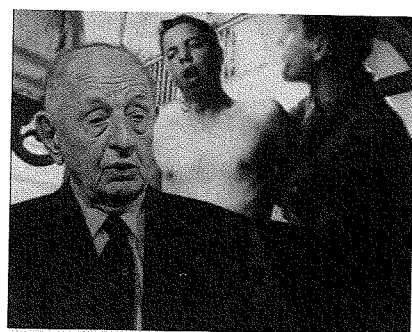
« Les Escadrons de la mort : l'école française » (2003).